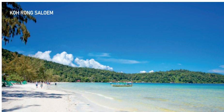
KOH RONG SALOEM

Petit déjeuner à l'hôtel et check-out. Temps libre jusqu'au transfert à l'aéroport de Phnom Penh pour notre vol de retour. Les chambres sont disponibles jusqu'à midi uniquement. Déjeuner et dîner libres et nuitée à bord. Transfert à l'aéroport. Vols retour vers la Belgique des souvenirs plein la tête.