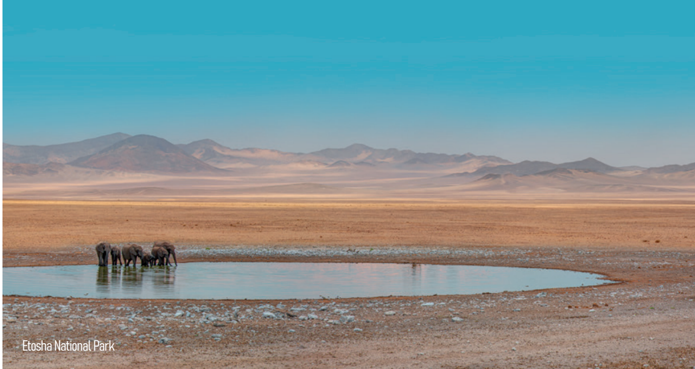
Etosha National Park

beauté. Nous prenons ensuite la route en direction du Parc National d'Etosha. Déjeuner en cours de route. Arrivée et installation à notre lodge suivie d'un temps libre.