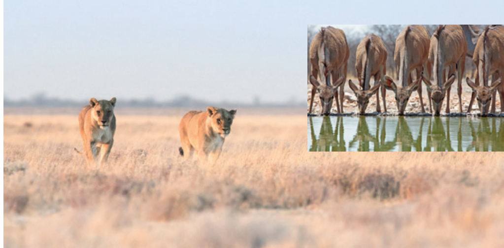
Etosha National Park

Déjeuner sur place. Départ pour une promenade le long des chutes d'Epupa autour de ce site exceptionnel appelé « l'eau qui fume ». Les chutes d'Epupa situées en pays Himba est l'autre trésor d'Opuwo. L'eau du fleuve Cunene ruisselle de partout entre les roches de granits, les baobabs et les palmiers, offrant un spectacle magique, surtout au coucher du soleil. La cascade la plus haute ne fait