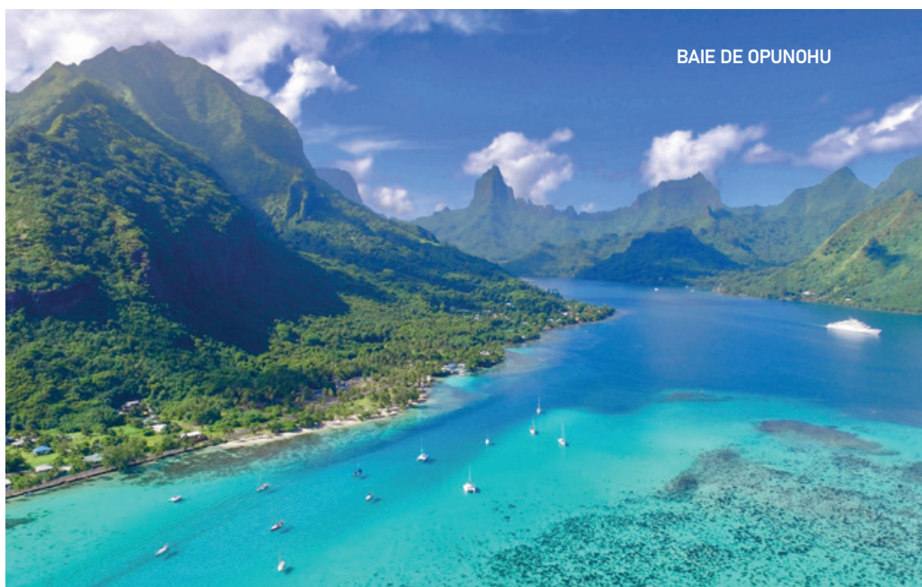
BAIE DE OPUNOHU

plages, tout est plaisir, calme et volupté. Aujourd'hui, nous partons pour l'excursion lagunaire Moana en bateau. La journée complète avec déjeuner au Motu. Lors de cette escapade en double-pirogue, nous naviguons dans les baies de Cook et d'Opunohu, puis le long de la côte nord de Moorea. L'objectif sera l'observation des requins pointe noire et des raies pastenagues dans les eaux cristallines et peu profondes du lagon. Une occasion exceptionnelle de côtoyer ces merveilles de la mer, voire de nager avec elles. Notre guide Nous contera les légendes de l'île et nous donnera des informations sur sa géographie mais aussi sur la vie des habitants. Une fois sur le Motu, nous profitons d'environ trois heures de temps libre dans une ambiance conviviale avec déjeuner barbecue, punch traditionnel, bières et softs ... Le buffet pique-nique à la tahitienne comprend poisson et poulet grillés, salades, fruits frais des